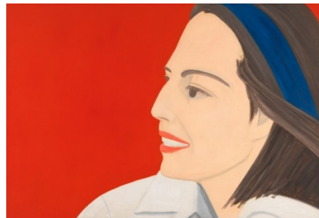
Alex Katz. The Red Smile , 1963. Whitney Museum of American Art, Nueva York.

A finales de la década de 1950, y tras un periodo de dudas creativas, Katz comenzó a interesarse cada vez más por el retrato. Pintaba a su círculo de amigos y, sobre todo, a su segunda esposa y musa, Ada del Moro, a la que conoció en 1958. Se convirtió en su modelo más frecuente, siendo la protagonista de más de 1.000 obras. Katz explica que sólo quería plasmar el aspecto del retratado, su superficie, sin implicarse emocionalmente.