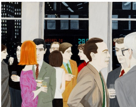
Alex Katz. The Cocktail Party , 1965. Colección privada, Chicago.

Desde mediados de la década de 1960 y durante los años siguientes, Katz retrató grupos de figuras, reflejando el mundo social de pintores, poetas, críticos y fotógrafos de su entorno. Sin embargo, ya no presenta las figuras sobre fondos planos, sino en entornos realistas. En The Cocktail Party (1965) aparecen once amigos del artista, perfectamente reconocibles, compartiendo una velada en su loft; una composición que recuerda a realistas franceses del siglo XIX, como Courbet, Manet o Fantin-Latour, que en sus retratos de grupo recogían la vida artística y literaria de París. A través de los cristales, se ve la noche de Nueva York, otras ventanas iluminadas y luces de neón, en una estampa que refleja la vida neoyorkina.