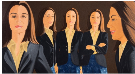
Alex Katz. The Black Jacket , 1972. Colección privada, Suiza.

Katz continuó explorando las posibilidades del retrato realizando series dentro del mismo lienzo. El retrato puede ser doble o múltiple, como una versión de la hoja de contactos en fotografía o la serie de fotogramas del cine. Sigue sin pretender profundizar en la psicología del retratado, ni mostrarlo en distintos roles o momentos de su vida, sino presentar al mismo sujeto desde diferentes puntos de vista. The Black Jacket