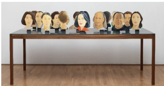
Alex Katz. Green Table , 1996. Colección privada.

La exposición también incluye la obra Green Table (1996), una mesa de madera sobre la que se presentan 17 cabezas pintadas o cutouts , una práctica que Katz empezó a desarrollar en 1959, casi de manera fortuita, con la que otorga una cierta tridimensionalidad a la pintura. En un primer momento, recortó el dibujo que había pintado en el lienzo, por no estar satisfecho con el fondo, y lo montó sobre un trozo de madera.