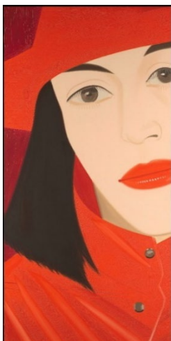
Alex Katz. Red Coat , 1982. The Metropolitan Museum of Art, Nueva York.

Fue entonces cuando se inició en los fondos planos, monocromáticos, que se convertirían en una de las características de su estilo. La figura se presenta separada del fondo, en un espacio desnudo, sin referencias espaciales, objetos ni fuentes de luz. Poco después, influenciado por la