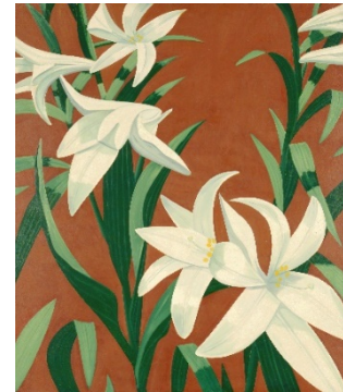
Alex Katz. White Lilies , 1966. Milwaukee Art Museum.

A finales de la década de 1960, Katz pintó grandes primeros planos de flores, solas o en pequeños ramos, como White Lilies (1966) y Rose Bud (1967). Le sirven para ensayar composiciones, superponiendo formas sin las limitaciones de los cuerpos, que deben mantener una verosimilitud en el espacio, y le permiten profundizar en su estudio del movimiento. Al igual que los retratos, son obras de gran tamaño y no se consideran naturalezas muertas ni fragmentos de paisajes. A principios del siglo XXI, Katz volvió a pintar flores, cubriendo lienzos enteros con capullos similares a los de esa primera época.