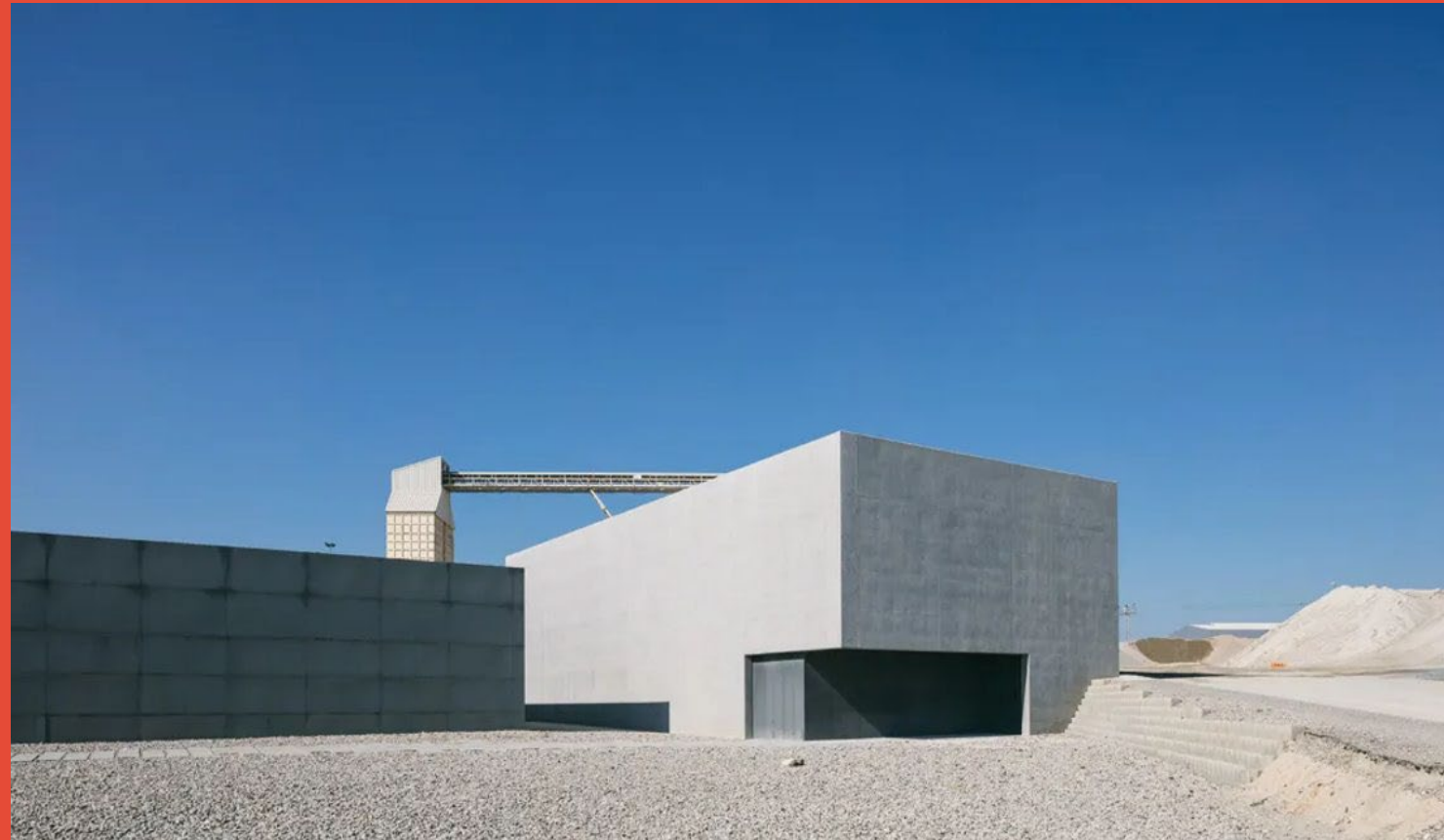
Planta Fundación Sorigué