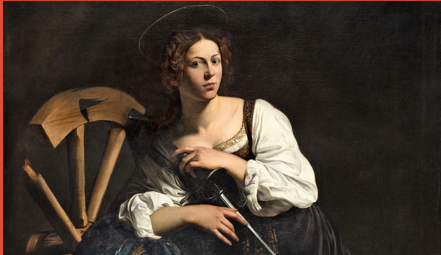
Caravaggio (Michelangelo Merisi) Santa Catalina de Alejandría , hacia 1598- 1599 (detalle) Museo Nacional Thyssen-Bornemisza, Madrid